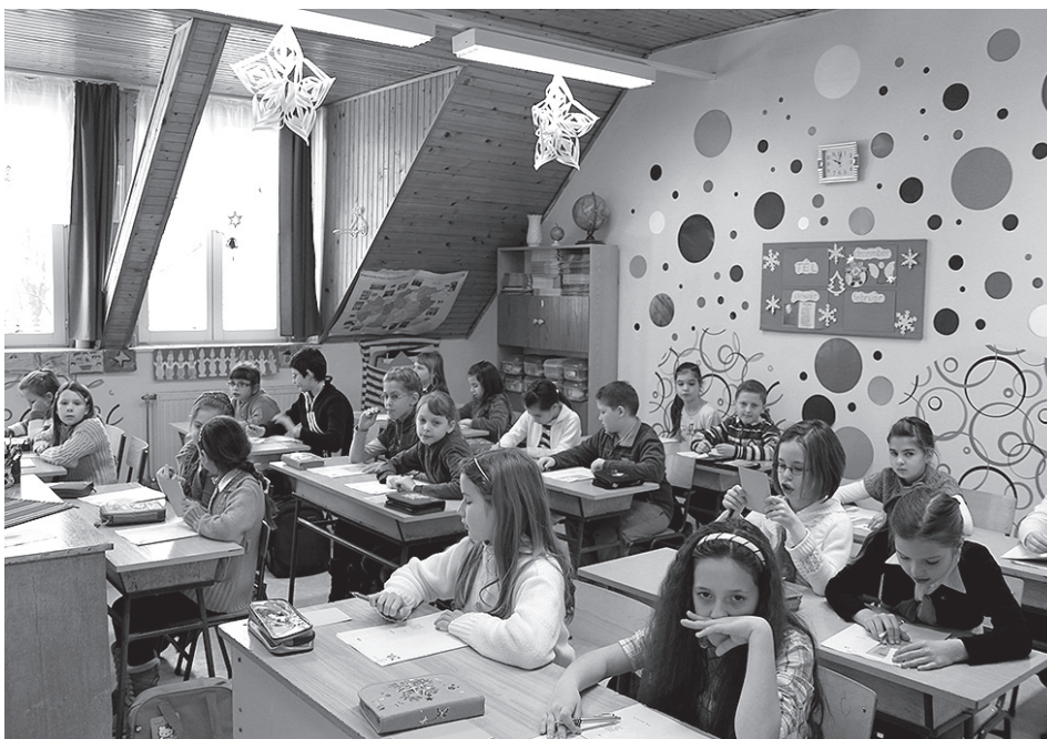
A versenyre érkezett diákok izgalommal várták a feladatokat

A Magyar Kultúra Napja tiszteletére ismét megrendezték az iskolában az Aranycsengőért zajló versenyt.